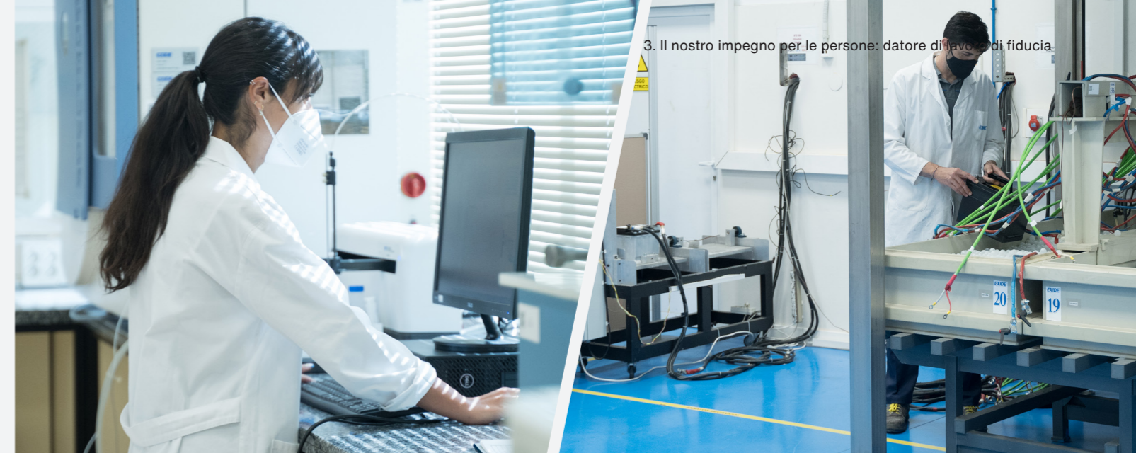
3. Il nostro impegno per le persone: datore di lavoro di fiducia.

Queste statistiche sono una testimonianza convincente della diversità e della dinamicità del nostro team, che riflette l'ampiezza dei talenti e delle esperienze che guidano la nostra azienda.