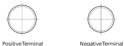
Positive Terminal Negative Terminal