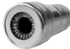
Art. nr. 2653010 Exide polskobørste