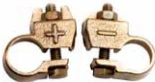
Art. nr. 2672655 Exide polsko sæt. Ford-kit, komplet.