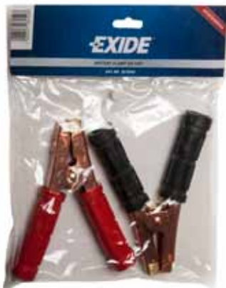
Art. nr. 2672845 Exide ladeklemmer 500A sæt.