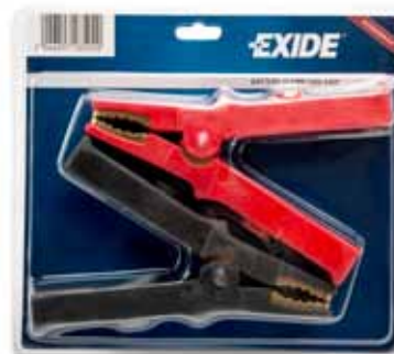
Art. nr. 2672850 Exide ladeklemmer, 1000A sæt.