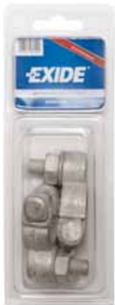
Art. nr. 2672825 Exide polsko sæt. Med 10 mm bolt.