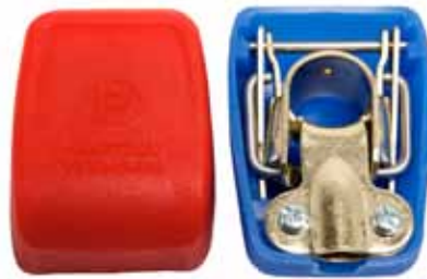
Art. nr. 2672840 Exide polsko sæt. Quick-power.