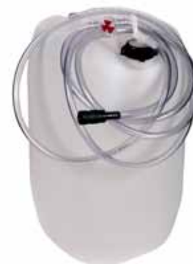
Dunk og slange BFS – GNB Deep Cycle