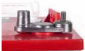
Skruepol 5/16" + rundpol