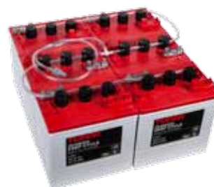
BFS – GNB Deep Cycle 36V system