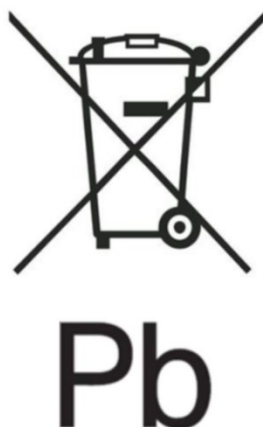
Figure 2 – Exemple de marquage avec le symbole de collecte séparée conformément à l'annexe VI, partie B, et avec le symbole chimique « Pb » pour la teneur en métal lourd Pb conformément aux articles 13.4 et 13